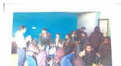
आईलैंड हेल्प लाइन 1098 कार्यक्रमाली, बैंगलूर